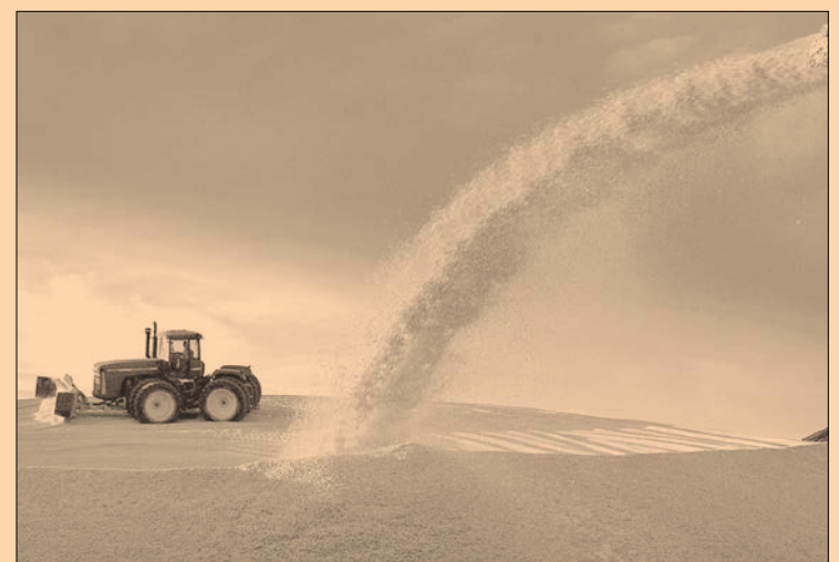
Se prevé que a finales de este año la cifra de maíz amarillo proveniente de Sudamérica ascienda a 700,00 toneladas.

“México importó de Brasil 85% más que en todo el 2016, aunado a las 67,400 toneladas que se han importado de Argentina en este