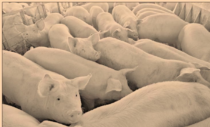
Los estados jalisciense, sonorenses y poblanos contribuyen con la mitad de la producción de carne en canal de porcino.

Servicio de Información Agroalimentaria y Pesquera, los principales productores de carne en canal de porcino son Jalisco, Sonora, Puebla y Yucatán, mientras en leche de bovino, los lí-