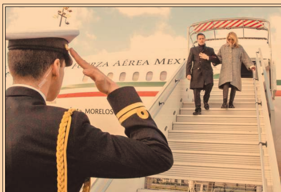
EPN y su esposa llegaron a París, donde el presidente participará en la Cumbre One Planet. P56