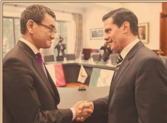
EPN ofreció defender a empresas japonesas en el marco del TLCAN ante el canciller Taro Kono.

REPORTÓ EL comportamiento de precios del 1 al 15 de mayo.