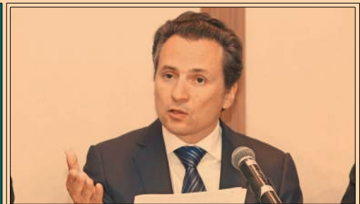
Emilio Lozoya Austin, EXDIRECTOR DE PEMEX.

“No existe un solo elemento de prueba o evidencia que acredite que yo recibí dinero”.