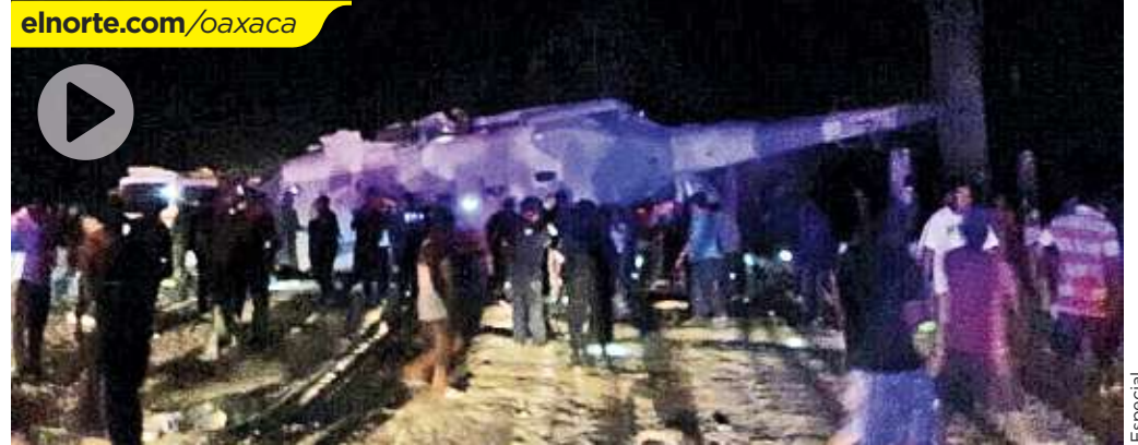
■ El helicóptero militar quedó anoche sobre vehículos en un paraje del municipio de Jamiltepec, Oaxaca. Según la Segob murieron dos personas, pero el Alcalde afirmó que fallecieron 10.

Cuando la nave, de fabricación rusa, se aproximaba a tierra sobre las 22:15 horas, levantó una enorme columna de polvo y, segundos después, se desplomó.