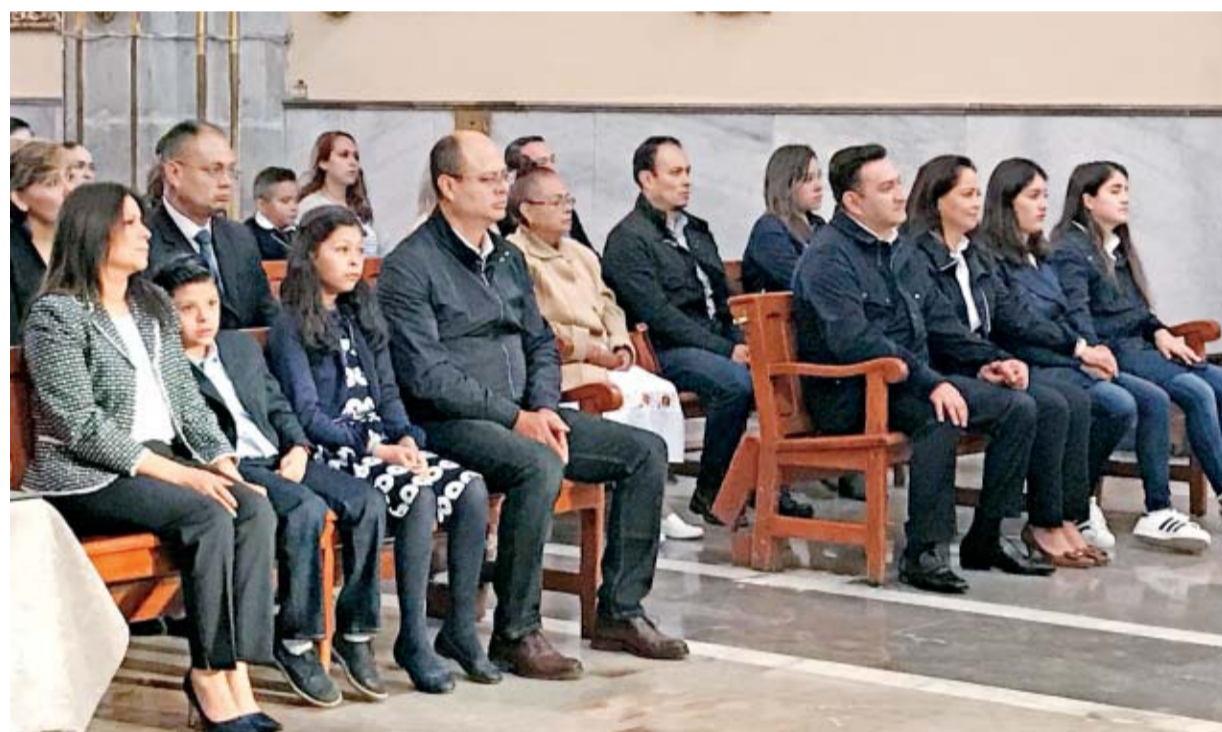
REBECA JIMÉNEZ. EL UNIVERSAL