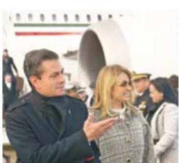
El Presidente y su esposa llegaron al aeropuerto Charles de Gaulle.