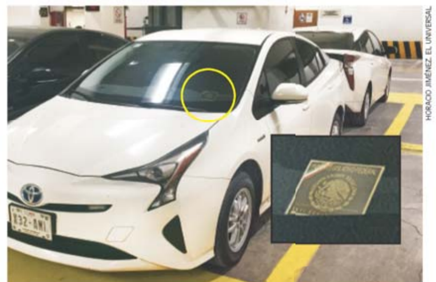
En el estacionamiento de la Cámara de Diputados hay varios vehículos Toyota Prius que ostentan la charola en el parabrisas.