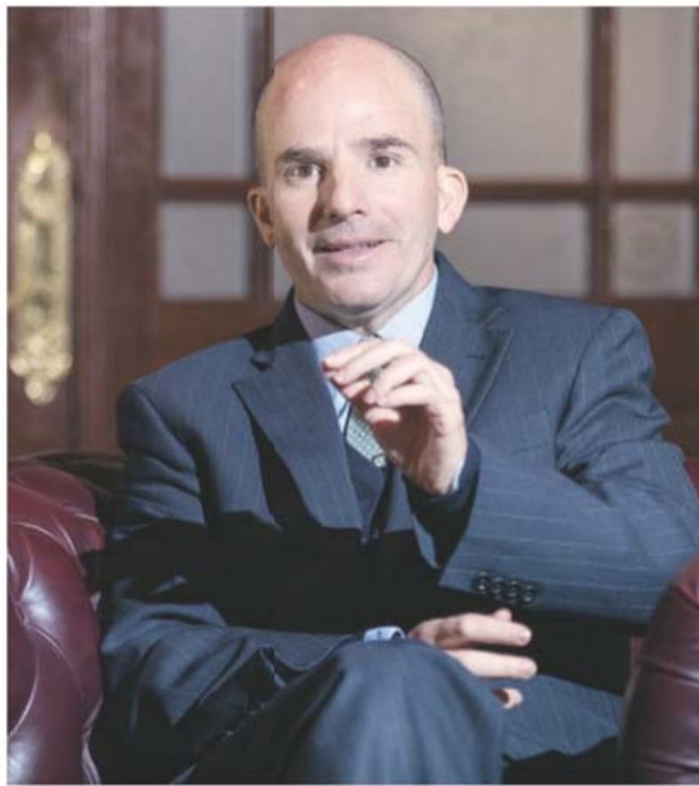
México", comenta en entrevista con EL UNIVERSAL.

En 2018 "navegaremos de la mejor maneja posible, y eso se hace a través de trabajo continuo y arduo, con políticas prudentes y conservadoras, que no siempre son las más populares, pero que le han servido bien a