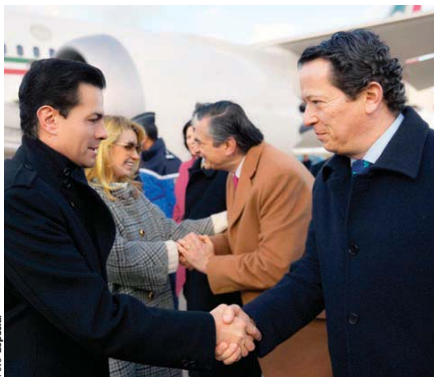
EL PRESIDENTE y la primera dama, Angélica Rivera, ayer, a su llegada al aeropuerto Charles de Gaulle, en París.

» El Presidente Enrique Peña llega a París para asistir a la Cumbre One Planet convocada por el mandatario francés Emmanuel Macron; también participa en la OCDE con la ponencia "Instrumentación de las Reformas Estructurales en México" pág. 4