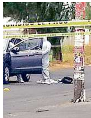
En enero ejecutaron al jefe de seguridad de la planta.

De acuerdo con las primeras indagatorias, en marzo, abril y mayo aumentaron los casos de robo de gasolina Premium, Magna y diesel en la refinera.