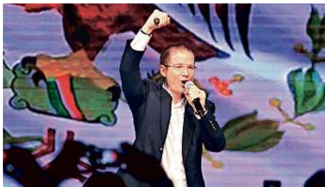
Anaya dio su primer mensaje como aspirante a la Presidencia.

"Hubo grandes avances, pero seamos sinceros y autocríticos: no cambiamos