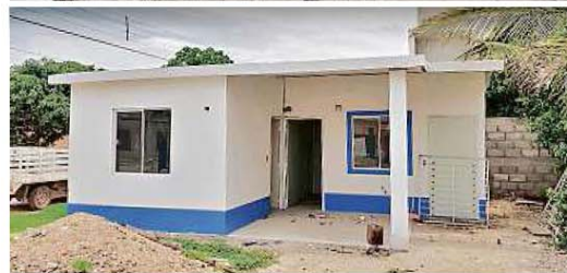
Fideicomiso Fuerza México

■ Debido al efecto multiplicador de la IP, la cifra total de inversión de reconstrucción es de mil 12 millones de pesos.