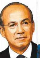
Felipe Calderón Fournier

2007 El favorable entorno económico, contrasta con los problemas de inestabilidad política y seguridad que padecía el país.