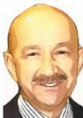
Carlos Salinas de Gortari

1989 Uno de los principales problemas que enfrentaba la economía eran los elevados niveles de la inflación