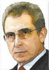
Ernesto Zedillo Ponce de León

1995 El país enfrentaba la peor crisis económica de la que se tuviera registro en años recientes, con un desplome de 5.8% del PIB