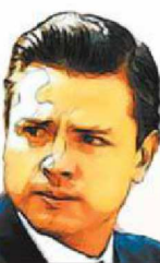
Enrique Peña Nieto

2013 Con el regreso del PRI a la presidencia, la economía entra en un severo proceso de desaceleración y altas tasas de desempleo