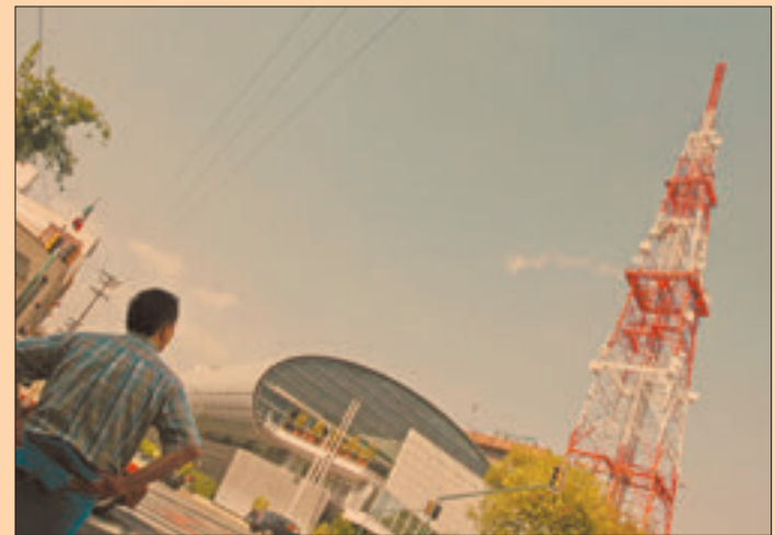
Grupo Televisa presentó resultados trimestrales positivos aunque los analistas esperaban mejores cifras.

Además, cuenta con la opción de compra de Cablecom, empresa de televisión de paga que podrá agregar libremente si las leyes