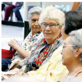
CAMBIO: El gobierno afirma que impulsará mejoras al sistema de pensiones para lograr retiros dignos de los trabajadores

En Chihuahua, el gobierno elevó a 35 años de labor los que debe cumplir un trabajador e incentivos de permanencia en el empleo