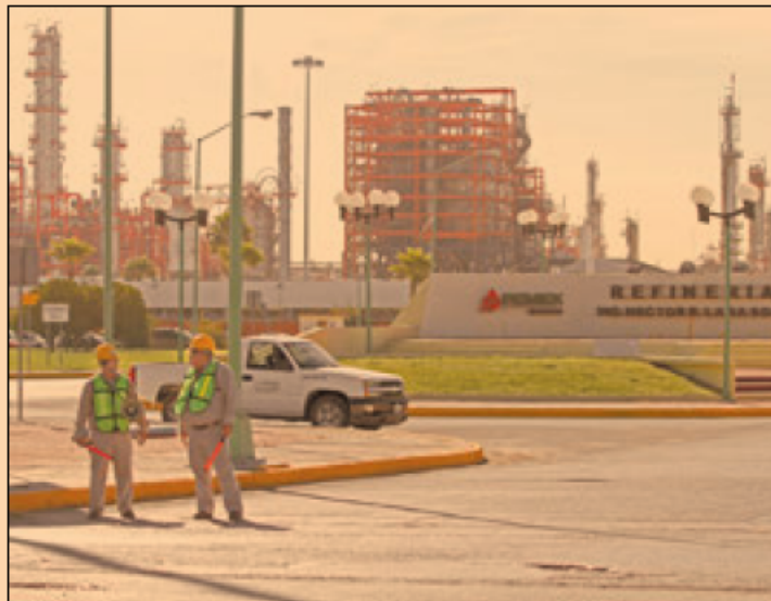
Pemex cuenta con una adecuada posición de liquidez, según la firma valuadora de riesgos S&P.

De acuerdo con uno de los reportes de la calificadora Standard