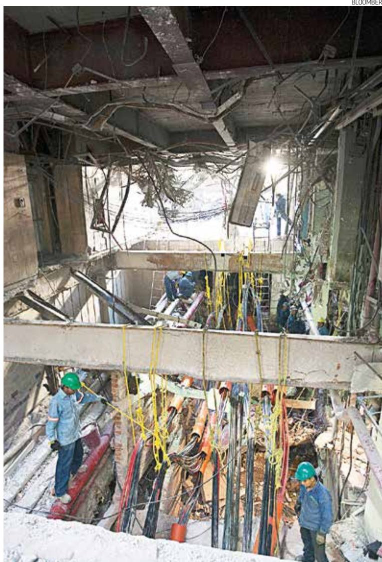
VÍCTIMAS. En la explosión fallecieron 37 personas y 129 resultaron heridas.