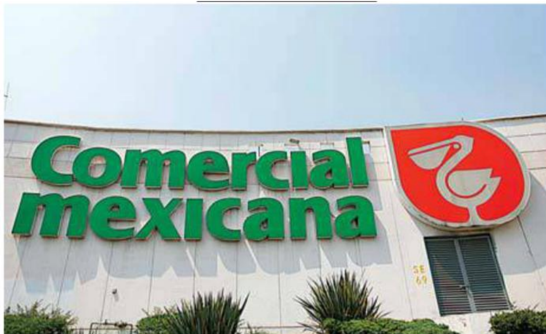
Con la compra de Comercial Mexicana, Organización Soriana se convertirá en el segundo lugar en autoservicios y tendrá una participación de 22% del mercado.

En 2013, Comercial Mexicana generó ventas por 47 mil 60 millones de pesos y un flujo operativo por 4 mil 16 millones de pesos, mientras que las