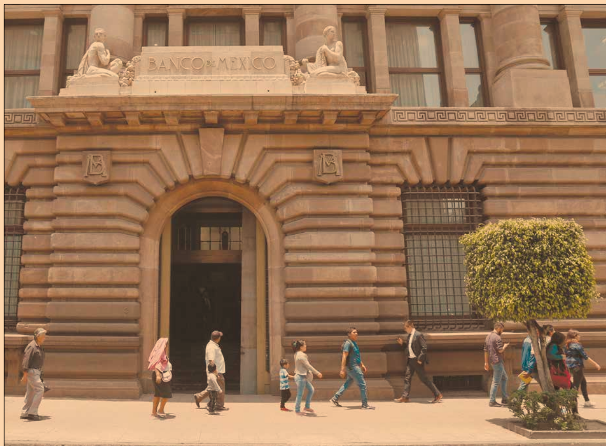
Citas pendientes. El Banco de México aún tiene tres reuniones este año de la Junta de Gobierno.