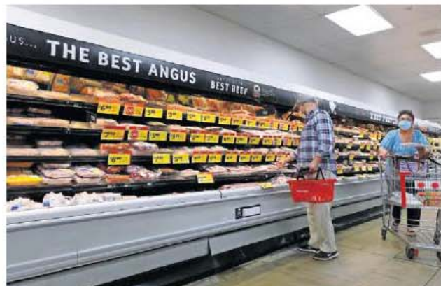
Estados Unidos reportó una inflación de 7.5% en enero pasado, la cual impacta en los costos de producción en México, advierten.