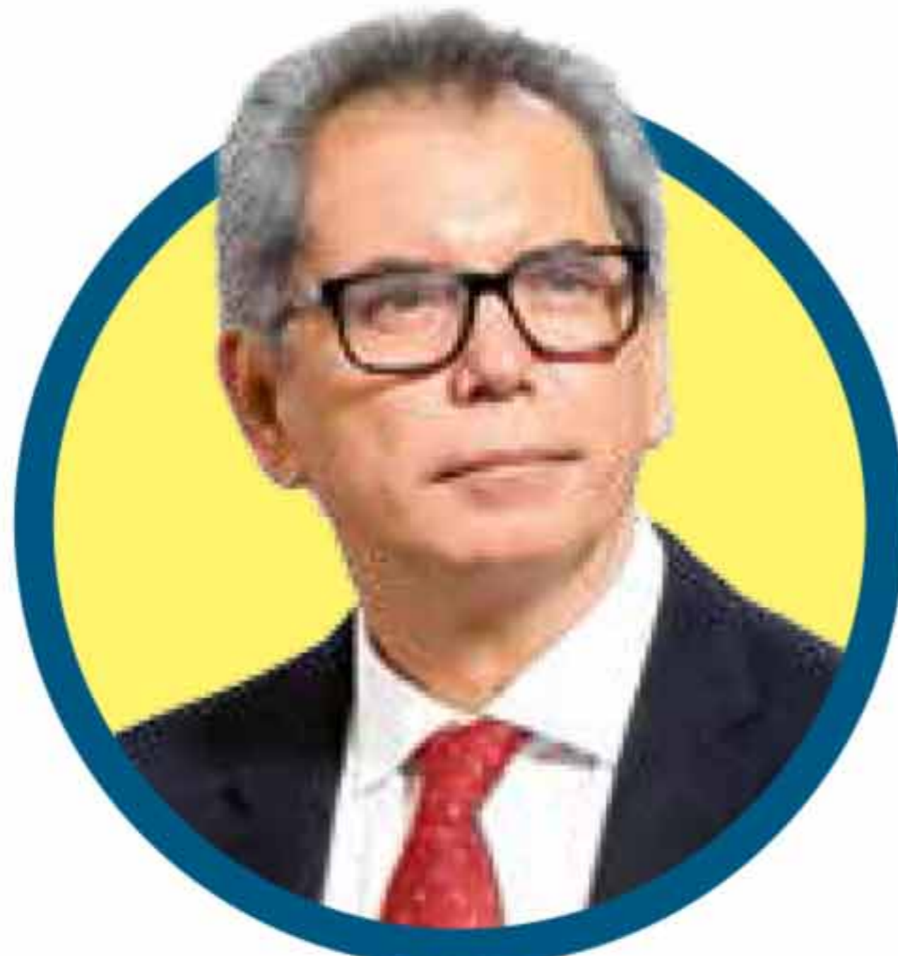
EDGAR AMADOR ZAMORA

SECRETARIO DE HACIENDA Y CRÉDITO PÚBLICO DE MÉXICO