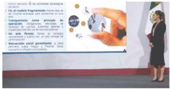
LA PRESIDENTA Claudia Sheinbaum, ayer durante la conferencia matutina.