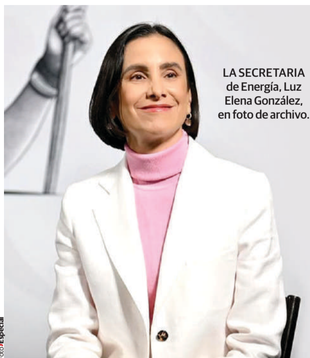
LA SECRETARIA de Energía, Luz Elena González, en foto de archivo.