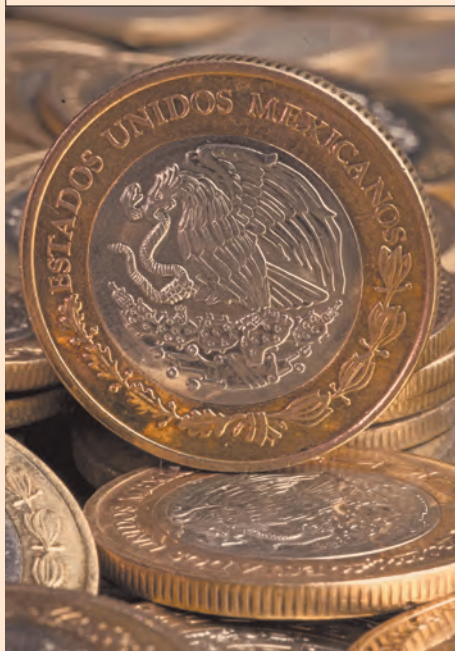
El peso ha ganado por el debilitamiento del dólar.

inflación/empleo en Estados Unidos, comentarios de la Fed o señales económicas en México)”.