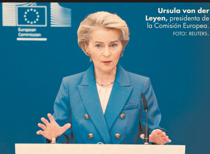
Ursula von der Leyen , presidenta de la Comisión Europea.